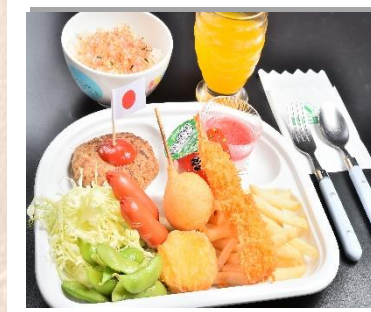
お子様ランチ (デザート、ジュース おもちゃ付) 800円