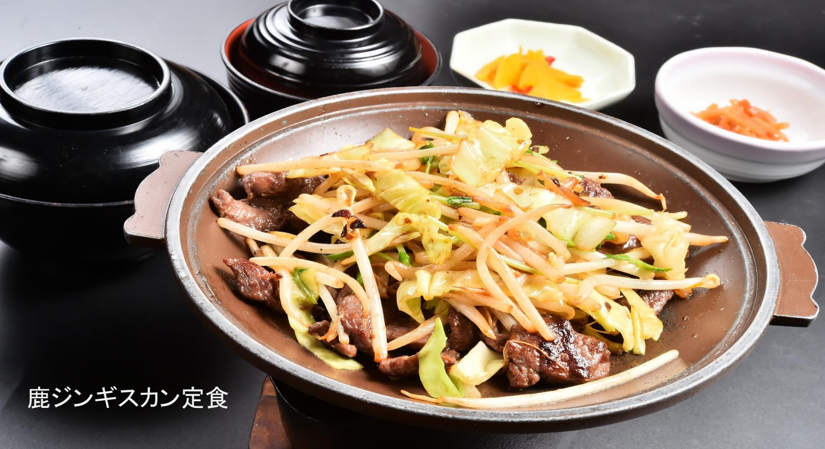
鹿ジンギスカン定食