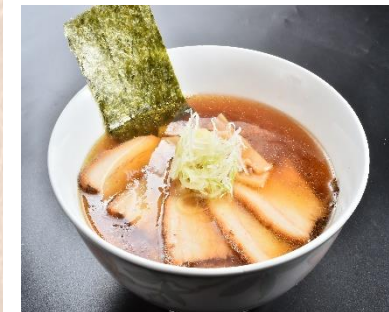
チャーシュー麺 980円 (大盛1,150円)